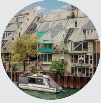
HARRY WEESE COTTAGES