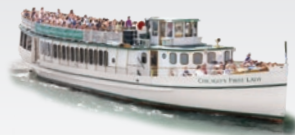
CHICAGO'S FIRST LADY