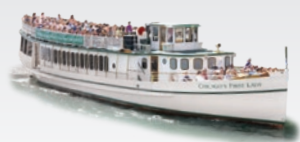
CHICAGO'S FIRST LADY