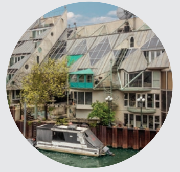
HARRY WEESE COTTAGES