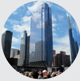
150 NORTH RIVERSIDE